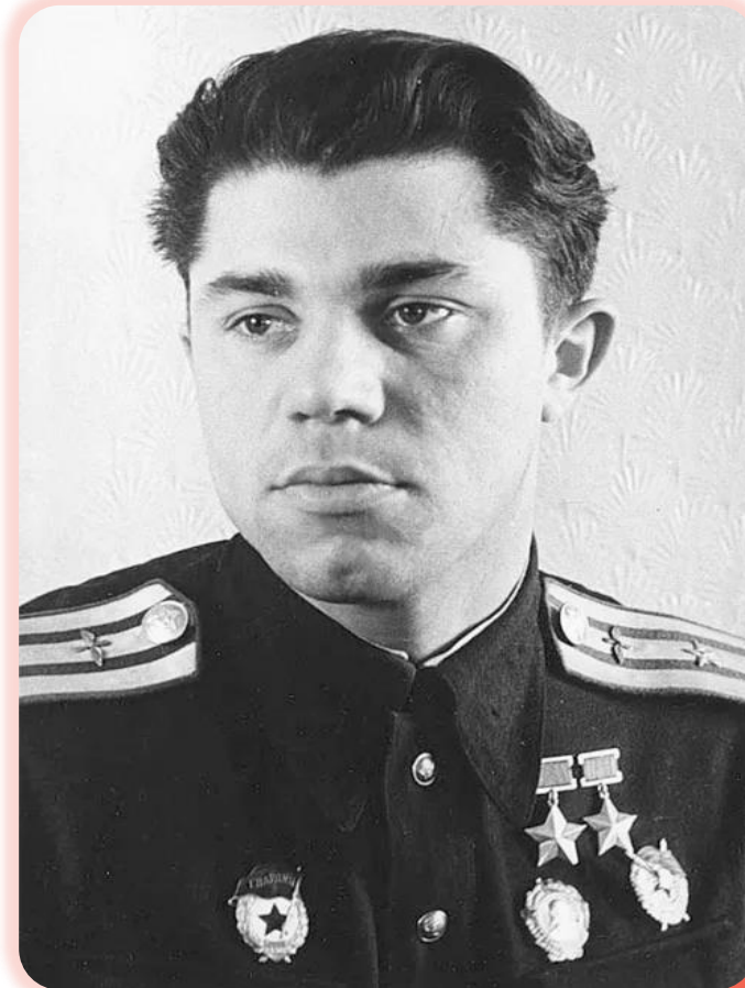
Молодчий Александр Игнатьевич (1920–2002)

8 октября 1948 г. на Красной площади в сквере г. Луганска был установлен бронзовый бюст героя. В 1969 г. напротив здания школы № 13, где учился военный летчик, также был установлен бюст. С 2008 г. школа № 13 носит имя Александра Молодчего, а в 2025 г. на фасаде школы была открыта мемориальная доска. 13.10.2010 Луганский городской совет принял решение о присвоении одной из улиц города имени Александра Молодчего.