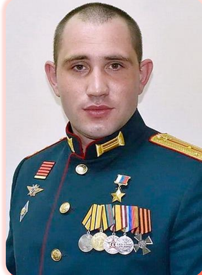
Алексей Олегович Хименко (родился 28 марта 1997 г. в Брянке, Луганская область)

Вручение Золотой Звезды Героя России Алексею Хименко проходило в Екатерининском зале Большого Кремлевского дворца 2 августа 2023 г. В октябре 2025 г. в литературной гостиной Дворца культуры г. Брянка работу начала передвижная выставка «Герои и подвиги: мои земляки — Герои России». На 21 стенде с фотографиями и краткой биографией изображены герои ВОВ, Чеченской и Афганской кампаний, битвы за Донбасс и СВО. Двое из них — Алексей Хименко и Геннадий Цапорин — родом из Брянки.